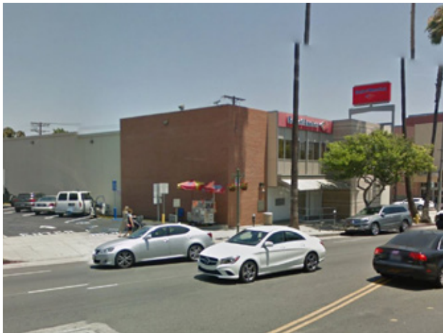
美國銀行 加州 | 237万