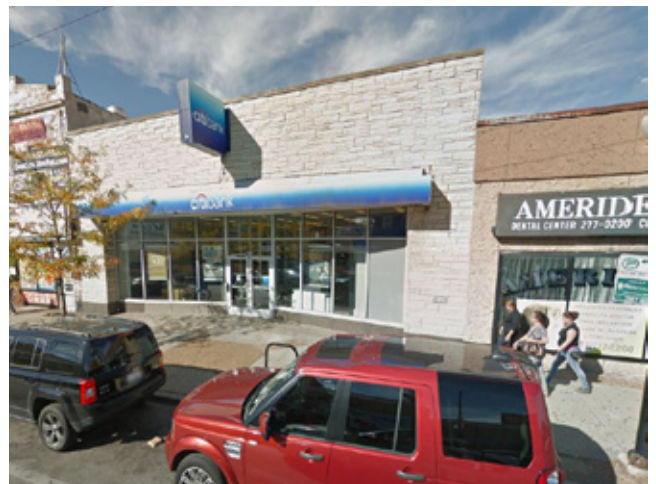
花旗銀行 芝加哥 | 240万