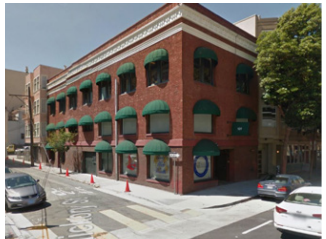
市中心办公楼 加州 | 1,200万