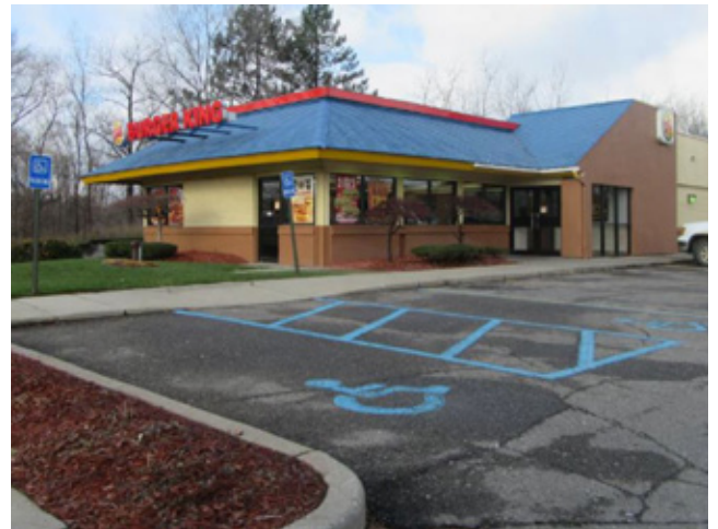
汉堡王快餐店 密歇根州 | 134.5万