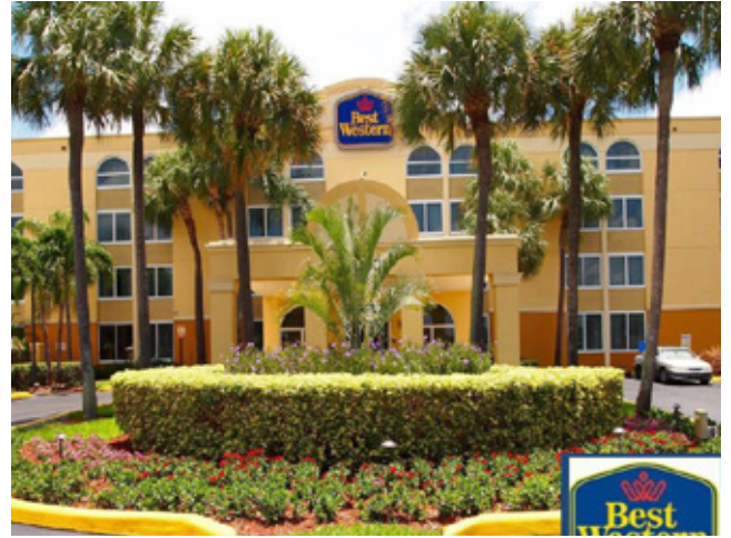
Best Western 酒店 邁阿密 | 890万