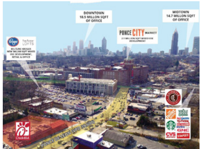
Chick-Fil-A 快餐 亞德兰大 | $NA