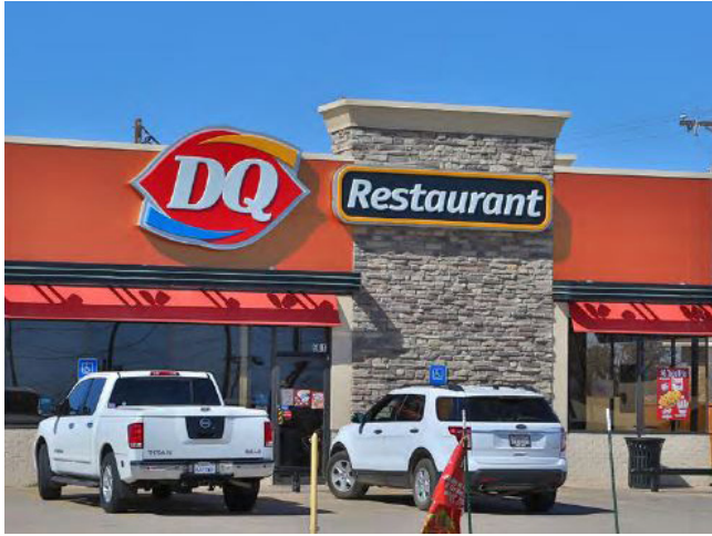
DQ 快餐店 德州 | 145万