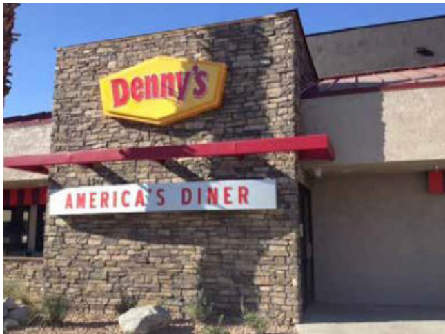
Dennys 餐廳 加州 | 250万