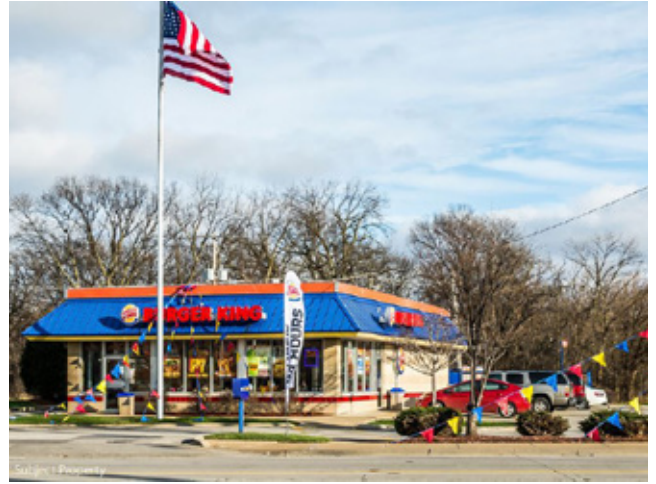
汉堡王快餐厅 芝加哥 | 224.36万