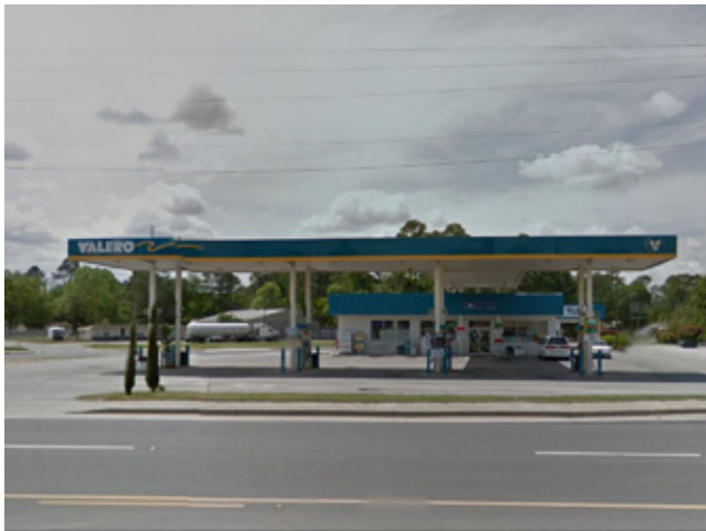
Valero 加油站 乔治亚 | 58.7万