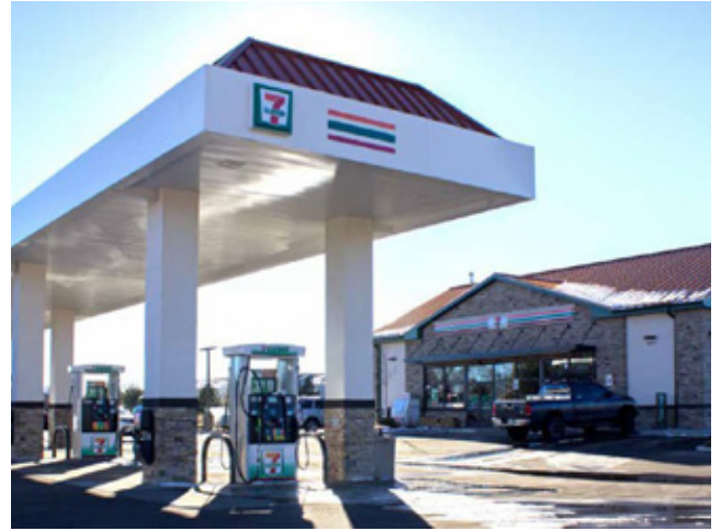
7-11便利店 + 加油站 丹佛 | 290万