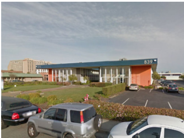
多租戶辦公樓 加州 | 1,270万