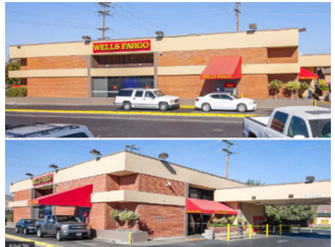
富國銀行 加州 | 221.5万