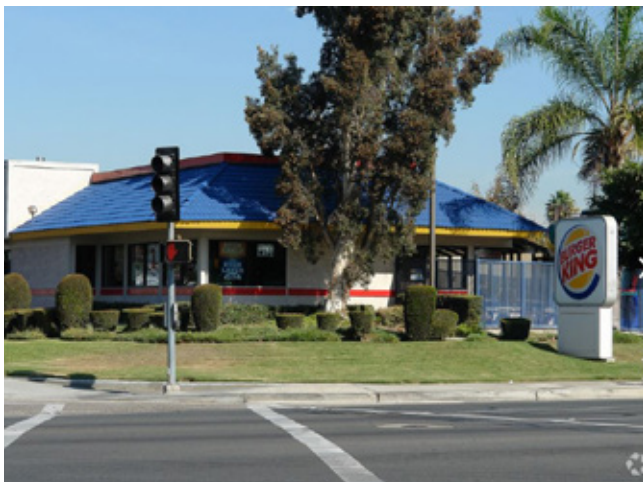
汉堡王快餐店 加州 | 249.5万