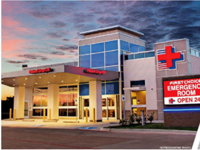
第一急診診所 德州 | 360万