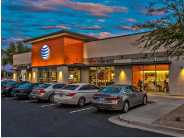
AT&T 手機通信 亞利桑那州 | 688.4万